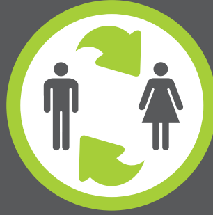
تركيزنا على نقل الخبرات

ترافق مجموعة الجنوب العالمي خطوطك أينما اتجهت. وفرق عملنا مستعدّة للسفر، بإشعارٍ قصير الأجل، إلى وجهاتٍ عديدة في رحاب منطقة الشرق الأوسط وأفريقيا – بما في ذلك المواقع التي تمتنع الشركات الأخرى عن السفر إليها.